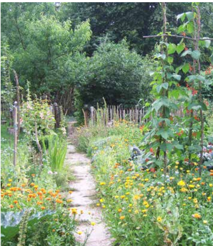
■ Gemüse- und Küchenkräuterbeet: Blühende Gemüsepflanzen und Küchenkräuter sind eine wertvolle Nahrungsquelle für Mensch und Tier.