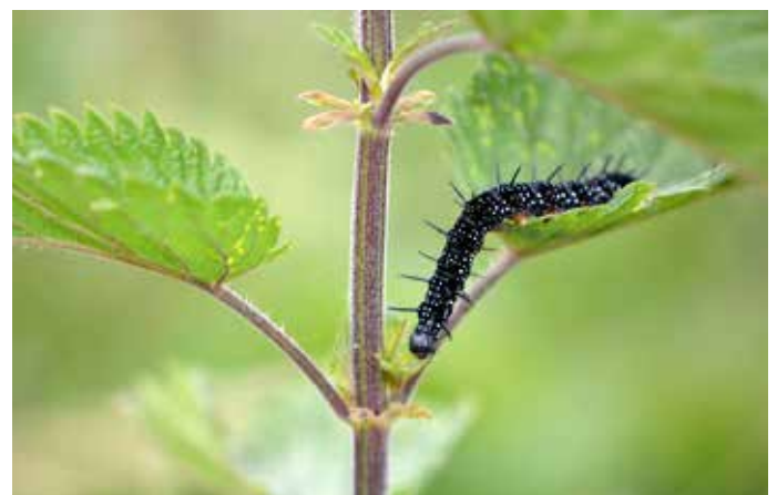
Brennnessel ( Urtica dioica )

Heimische Rosen sind nicht nur eine sehr gute Nektar- und Pollenquelle, sondern auch eine Augenweide. Nicht nur der Rosenkäfer, sondern auch viele andere Arten nutzen die Blüten und auch die Hagebutten.