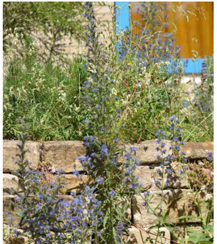
■ Trockenmauern, Natursteinhaufen und Schotterrasen sind eine Alternative zu Beton. Sitzplätze, Wege und Auffahrten können begrünt werden. In breiten Fugen siedeln Insekten.