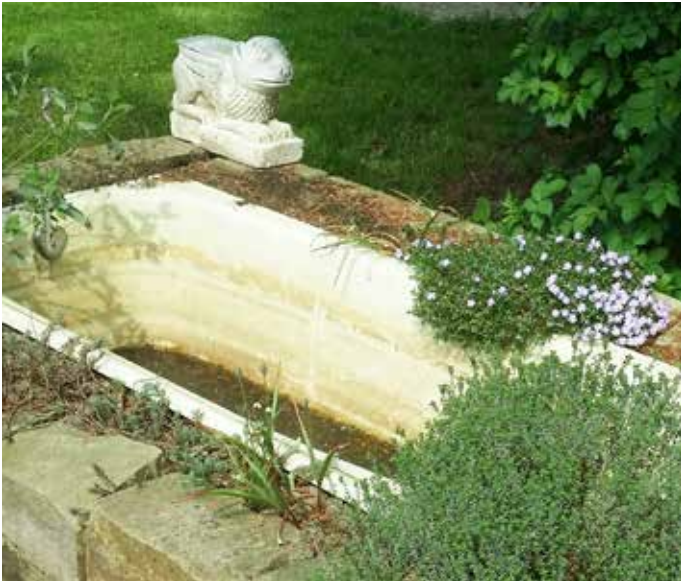
Zweites Leben für die Badewanne