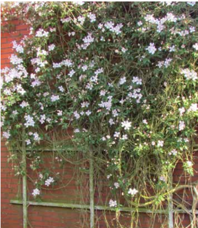
■ Rankende Pflanzen begrünen Fassaden, Sichtschutzelemente, Mauern, Zäune und abgestorbene Bäume oder Pfosten. Auch Flachdächer von Häusern, Garagen oder Schuppen können gut bepflanzt werden.