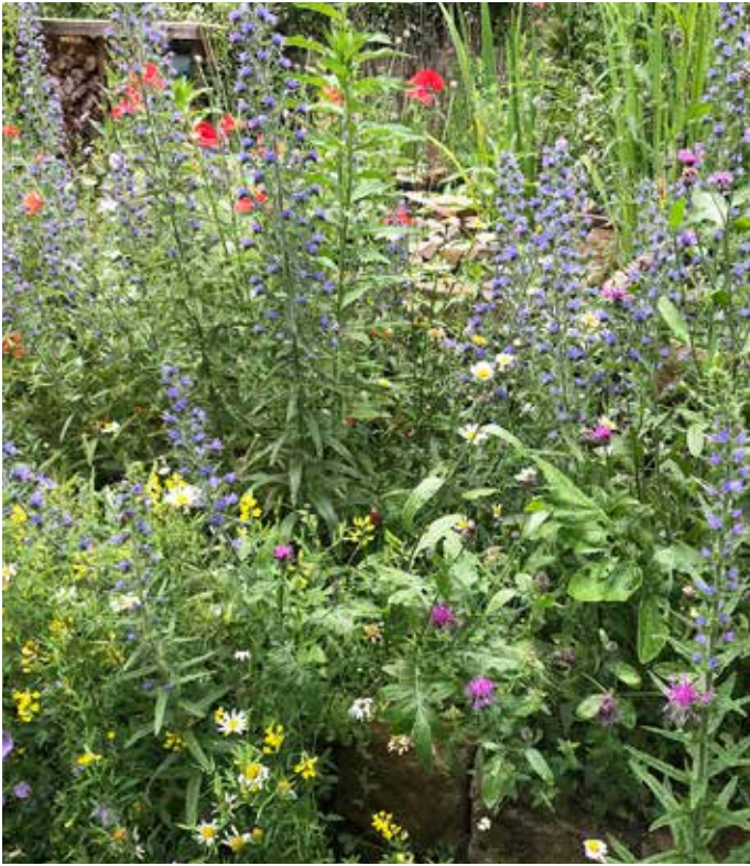
■ Beete und Staudensäume mit heimischen Kräutern finden sich vor Hecken, Zäunen und Mauern. Ihre Stängel bleiben als Nist- und Überwinterungsquartier bis zum nächsten Frühjahr stehen.