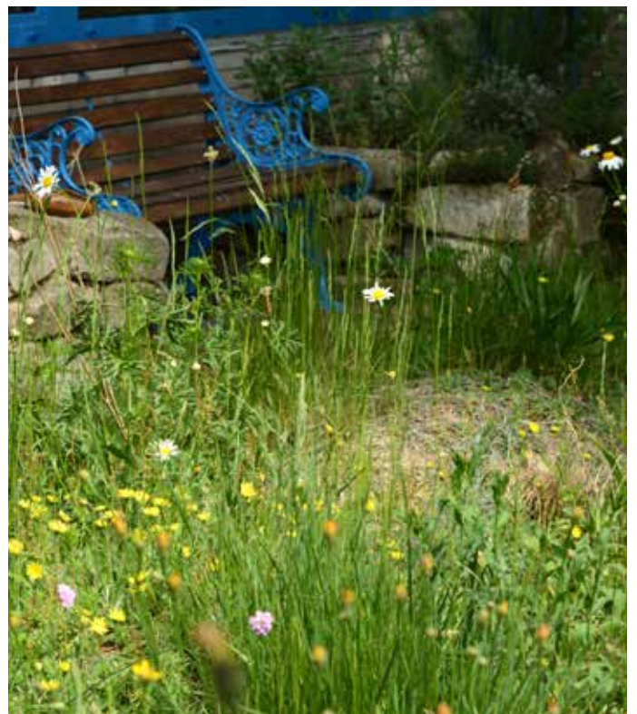
■ Unversiegelte Sitzplätze laden zum Entspannen und Beobachten ein. Es bieten sich gemähte Wiesenbereiche oder blumenreiche „Schotterrasen“ an.