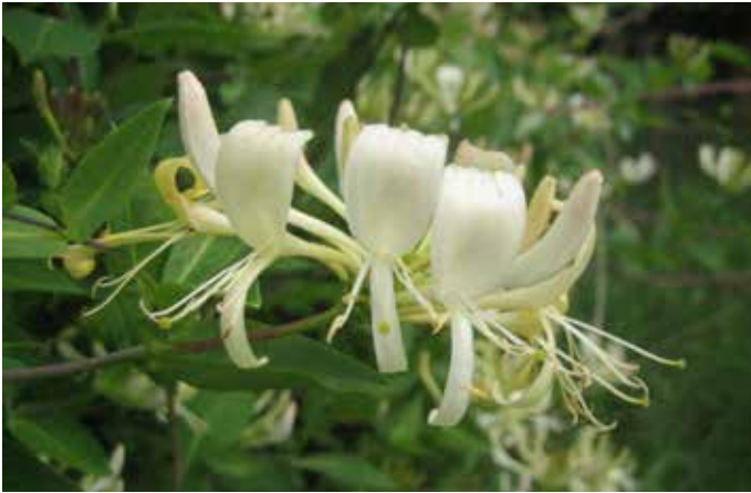
Geißblatt ( Lonicera periclymenum )

Rankpflanze des Waldrandes, deren Blüten von langrüsseligen Schmetterlingen, insbesondere Nachtfaltern, angefliegen werden, z. B. von Taubenschwänzchen und anderen Schwärmern.