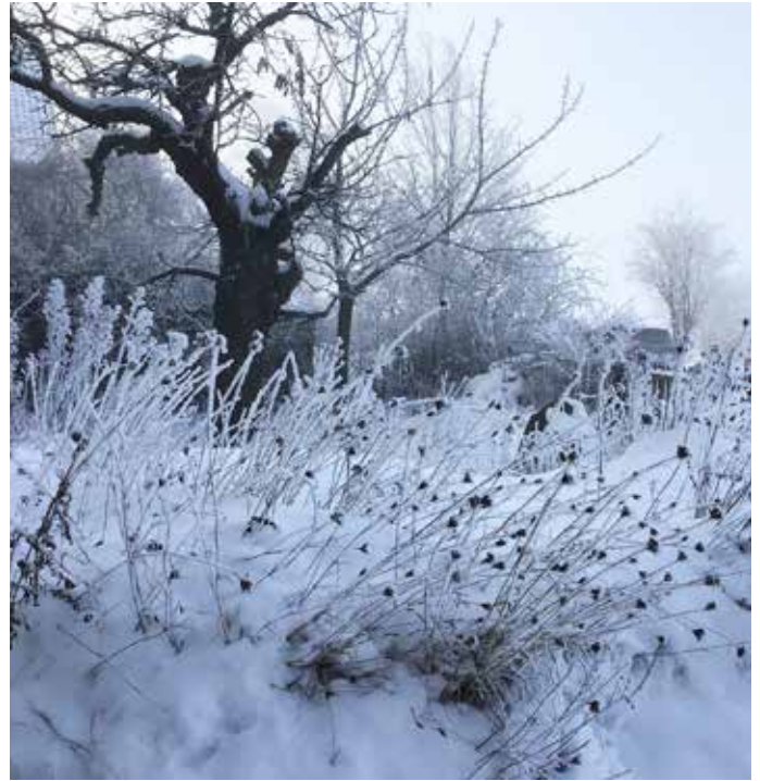
Pflanzenstängel bleiben im Winter stehen