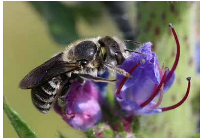
Natterkopf ( Echium vulgare )

Efeu bildet Blüten in seiner Altersform, ab einem Alter von etwa 10 Jahren. Er blüht dann im September und ist für die dann noch fliegenden Insekten, z. B. die Efeu-Seidenbiene, lebenswichtig. Die Beeren reifen gegen Ende des Winters. Darauf sind Amseln, Stare, Mönchsgrasmücken u.a. Vogelarten angewiesen.