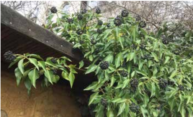
Efeu ( Hedera helix )

Diese zweijährige Pflanze sieht einer Distel ähnlich. Ihre Blüten sind Insektenmagnete, die Samen werden von Stieglitzen geliebt. Sehr dekorativ auch im Winter.