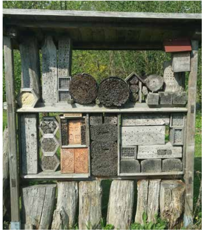
■ Nisthilfeelemente und Nistkästen für Insekten und Vögel müssen fachgerecht gebaut sein und entsprechend der Bedürfnisse der einzelnen Arten angebracht werden.