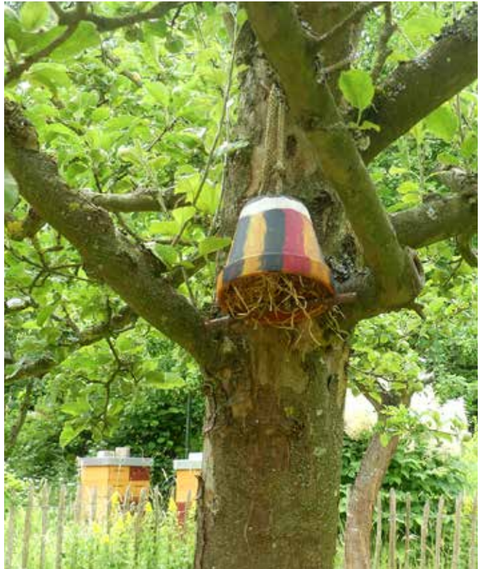
Holzwohle-Glocke für Ohrenkneifer