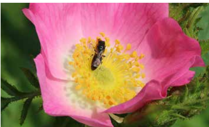
Ungefüllte Rosen, Wildrosen (Rosaceae)

Eine leuchtend blau blühende zweijährige Art, Lebensgrundlage für spezialisierte Bienenarten.