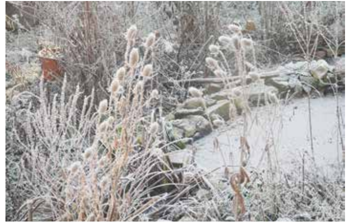
Wilde Karde ( Dipsacus fullonum )

Rankpflanze des Waldrandes, deren Blüten von langrüsseligen Schmetterlingen, insbesondere Nachtfaltern, angefliegen werden, z. B. von Taubenschwänzchen und anderen Schwärmern.