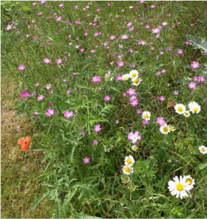
Kornrade, Klatschmohn und Wiesenmargerite