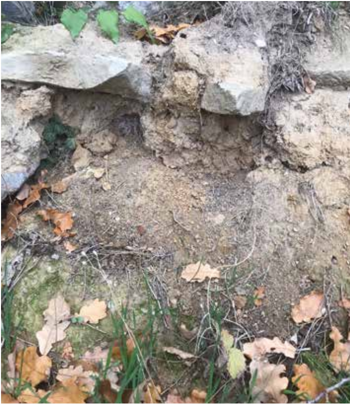
■ Natürliche Abbruchkanten, Erdhügel und Lehmwände: Sie dienen als Insektennistplatz und werden von Vögeln und Insekten zur Gewinnung von Baumaterial aufgesucht.