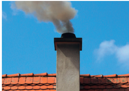
Holzöfen erzeugen in Deutschland mehr giftigen Feinstaub als Lkw- und Pkw-Motoren.