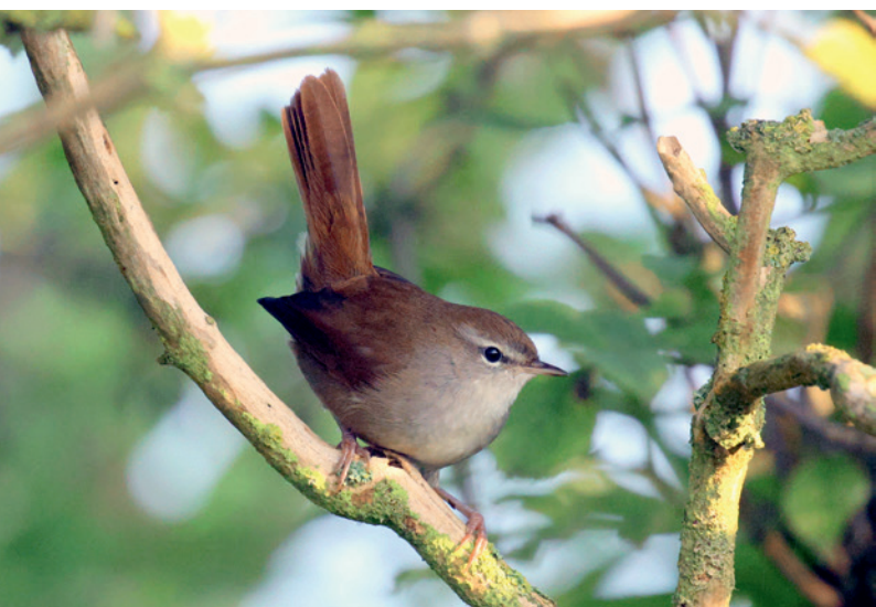
Nur sehr selten zeigt sich der Seidensänger Cettia cetti so frei wie in diesem Moment an den KT Rethen, 31.08.2023.