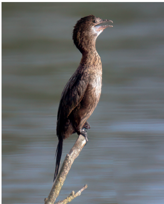
Die K1-Zwergscharbe Phalacrocorax pygmaeus an ihrem Lieblingsplatz am Koldinger See, 17.09.2023.