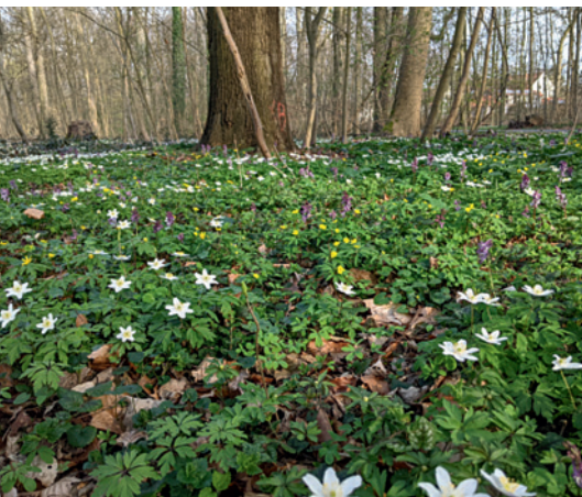
Buschwindröschen und Hohler Lerchensporn.

Egal, wann ich durch die Eilenriede gehe, schön ist sie immer. Am schönsten vielleicht im Frühling, wenn die Bäume noch kahl sind oder erst ganz kleine Blätter und Knospen haben, wenn der Lerchensporn nicht nur mit seinen weißen und lila Blüten das Auge, sondern mit seinem ganz zarten eigenen Duft auch die Nase erfreut. Wenn die Windröschen blühen, meist in Weiß, an manchen Stellen auch in Gelb. Das Scharbockskraut mit seinen fast glänzenden sternförmigen Blütenblättern leuchtet kräftig im trockenen, braunen Laub des Vorjahres. Die Aronstäbe haben ihre markanten Blätter geschoben, die Blätter vom Giersch sind noch jung und hellgrün.