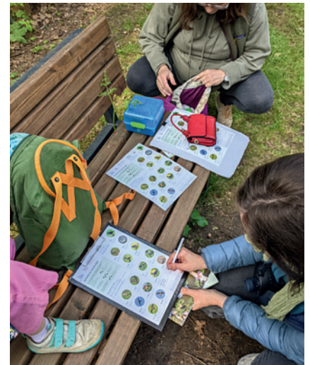
Eintragung der Ergebnisse der Vogelzählung.

Um die Zählung nicht zu verfälschen, erklärte sich jeweils eine Person pro Gruppe bereit, die Zahlen beim NABU-Online-Meldeformular einzugeben.