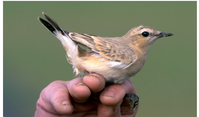
Der K1-Isabellsteinschmätzer Oenanthe isabellina bei seiner Beringung am 22.10.2023 in der Feldmark zwischen Pattensen und Hüpede.