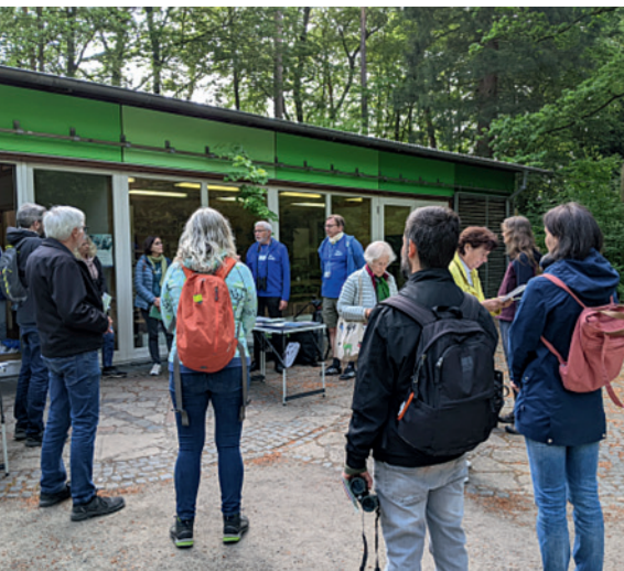
Briefing zur Vogelzählung in der Waldstation Eilenriede.

Zur Stunde der Gartenvögel haben wir vom NABU Hannover in diesem Jahr mit der Waldstation Eilenriede kooperiert und dorthin zur Zählung eingeladen. Die Mitarbeitenden der Waldstation hatten veranlasst, dass die Zählung in der Broschüre „Grünes Hannover“ beworben wurde. Wir als NABU kündigen unsere Veranstaltungen auf unserer Homepage, im Mitgliedermagazin HVV info und seit Neuestem auch über Instagram an.