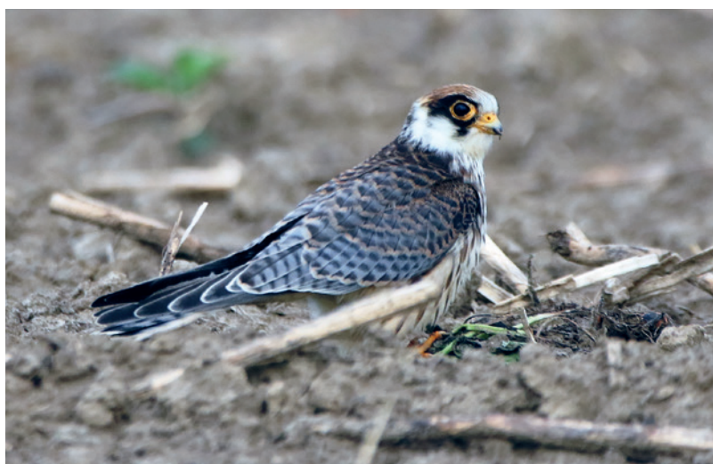
Ein K1-Rotfußfalke Falco vespertinus am 21.09.2023 in der Feldmark von Jeinsen.