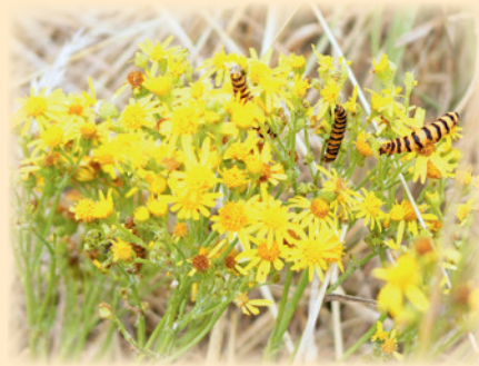
Raube des Blutbären auf Jakobs- kreuzkraut.