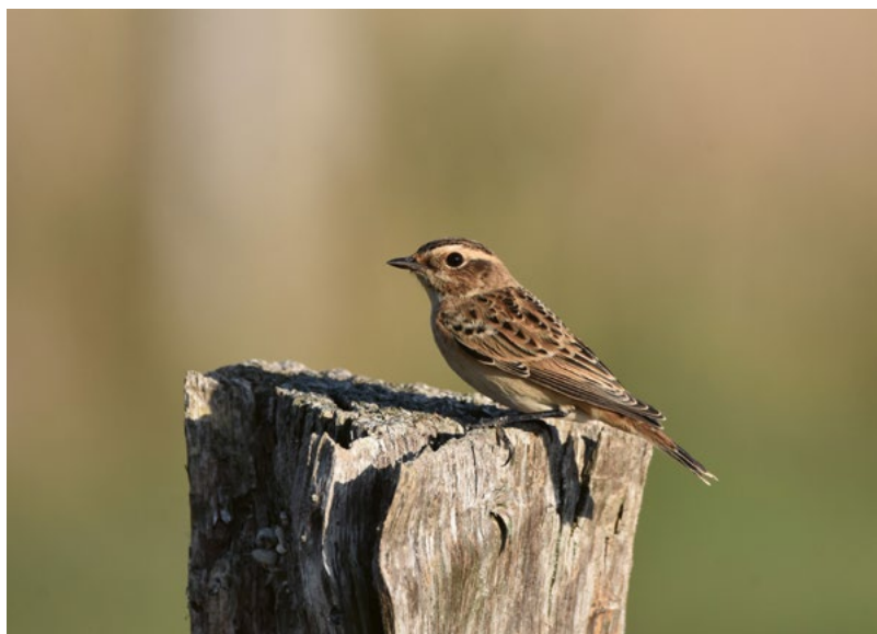
Braunkehlchen Saxicola rubetra (K1) im Brinksoot, Wülferode 05.09.2018.