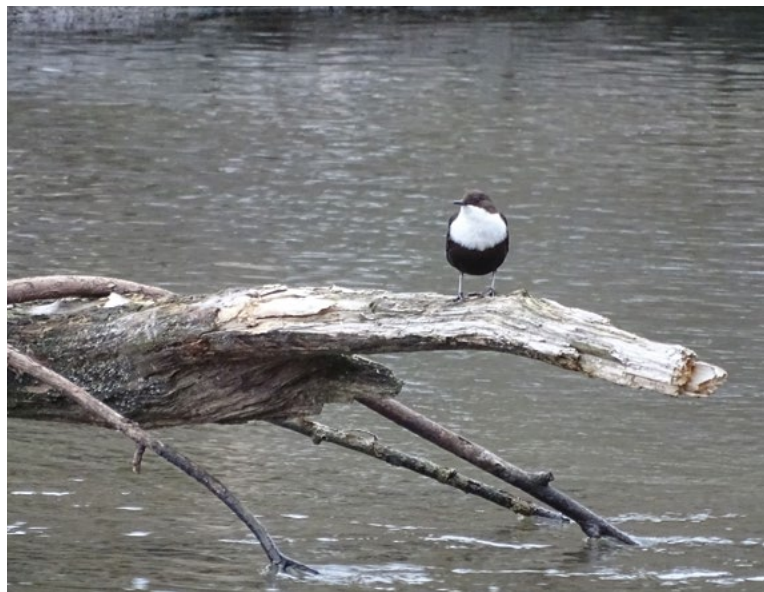
Die Wasseramsel C. c. cinclus auf einer Ansitzwarte, Hannover-Limmer 20.12.2018.