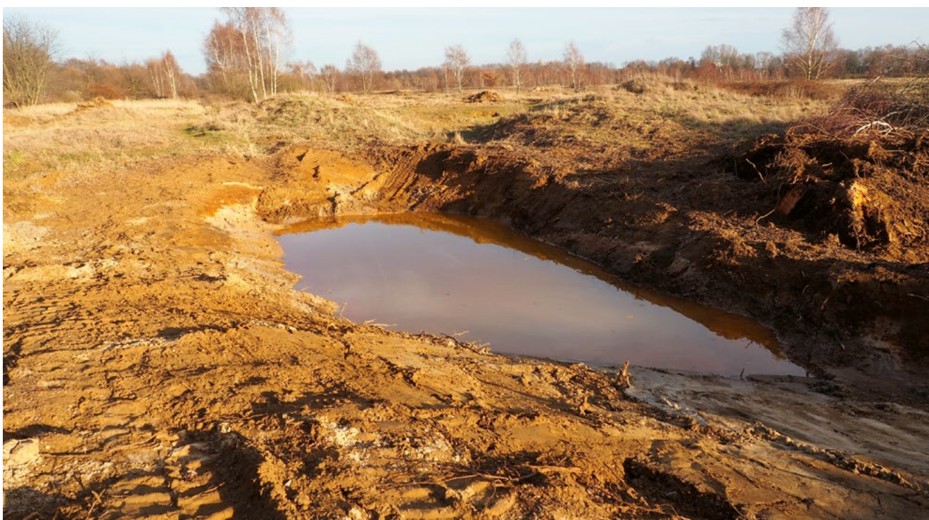
Eines der neu angelegten Kleingewässer auf der Kugelfangtrift.