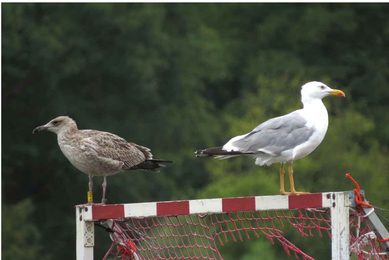
Sportlich interessierte Steppenmöwe Larus cachinnans (K1) mit Mittelmeermöwe Larus michahellis (ad.), Hannover 15.08.2018.