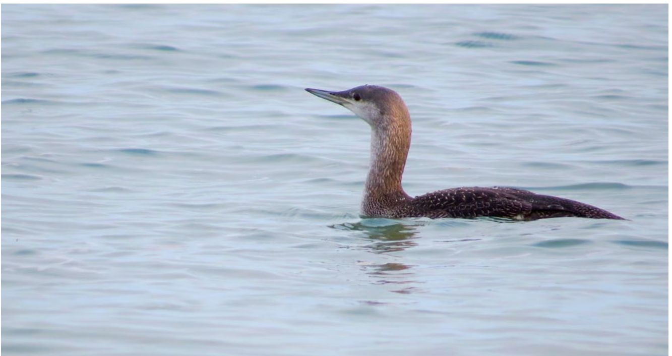
Sterntaucher Gavia stellata (K1), Helgoland 18.10.2017.

Durch die freifliegenden Zoovögel wird leider verhindert, dass Wildvögel in und um Hannover als solche erkannt werden. Nicht nur im Hinblick auf klimabedingte Veränderungen gehen der Wissenschaft hier unter Umständen wichtige Erkennt-