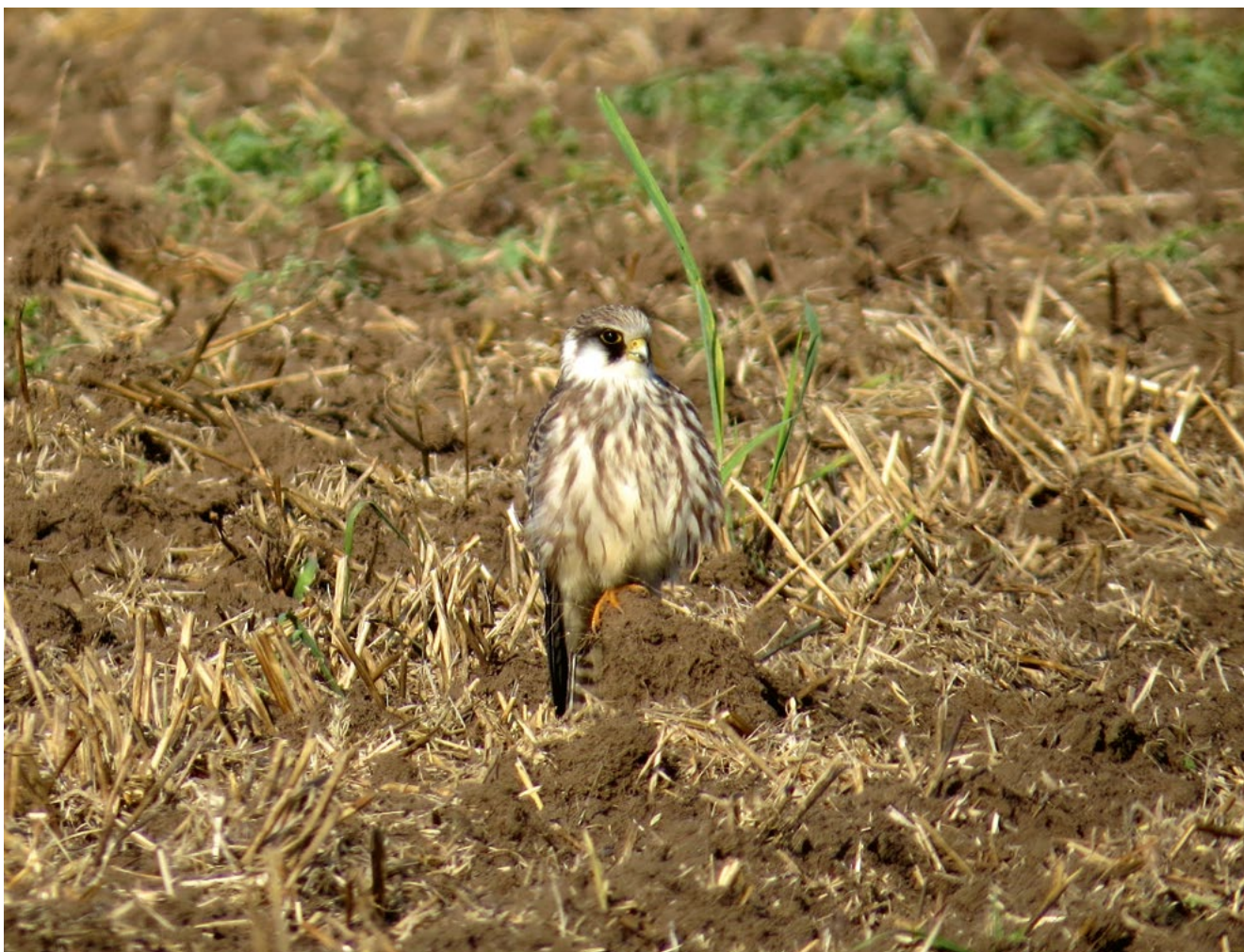
Am Boden ist ein junger Rotfußfalke Falco vespertinus manchmal schwer zu entdecken, Isernhagen 18.09.2014.