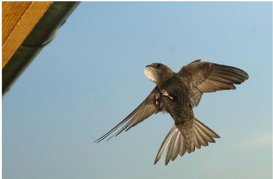
Ein Mauersegler Apus apus fliegt mit vollem Kropf seinen Nistplatz an. Archivbild vom 12.07.2010.

nachgewiesenen Substanzen ist teilweise seit vielen Jahrzehnten untersagt. DDT beispielsweise ist schon seit den Siebziger Jahren verboten 3 . Allerdings wird es nach wie vor zur Malariabe-