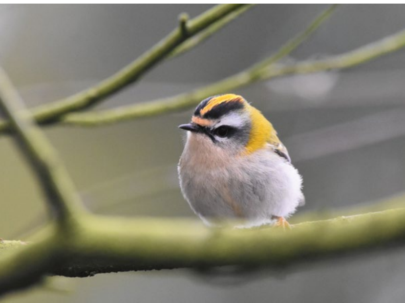
Sommergoldhähnchen Regulus ignicapilla, Diepholz 02.04.2018.