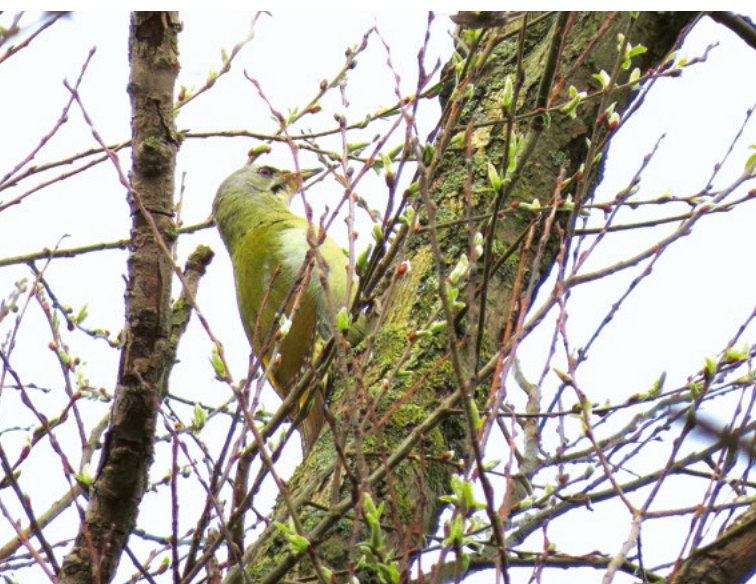
Grauspecht Picus canus , Laatzten 31.03.2016.