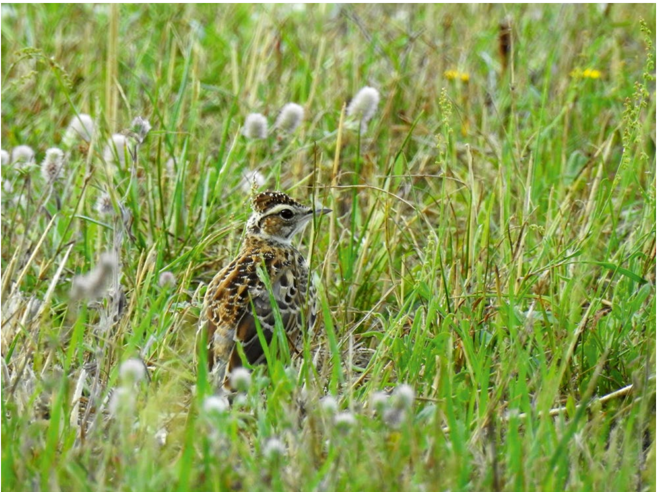
Heidelerche Lullula arborea im hübschen Jugendkleid, Burgwedel 26.07.2019.