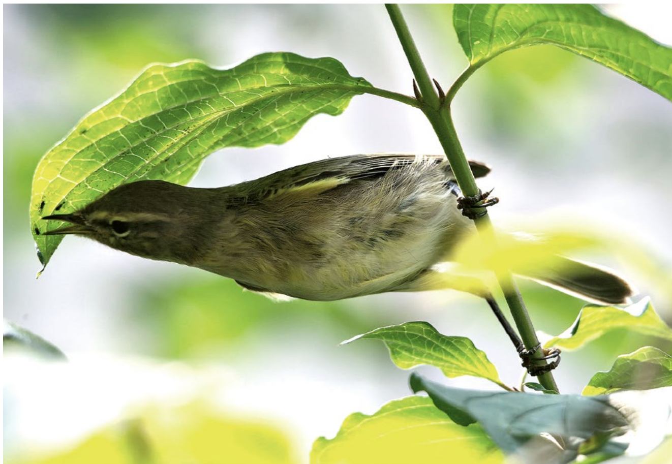
Zilpzalp Phylloscopus collybita beim Absammeln von Blattläusen, Laatzten 06.09.2014.