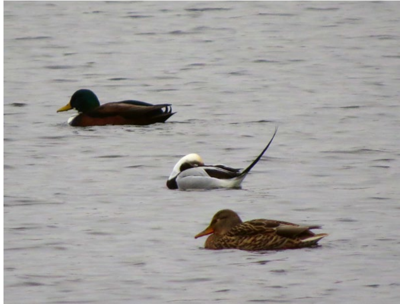
Die im Vergleich zu den Stockenten deutlich kleinere Eisente Clangula hyemalis (♂) verschlief ihren Foto-termin leider, Altwarmbüchener See 23.11.2018.

Gänsesäger Mergus merganser (V/R): Anfang September kehrten auch die ersten Gänsesäger in die Südliche Leineaue