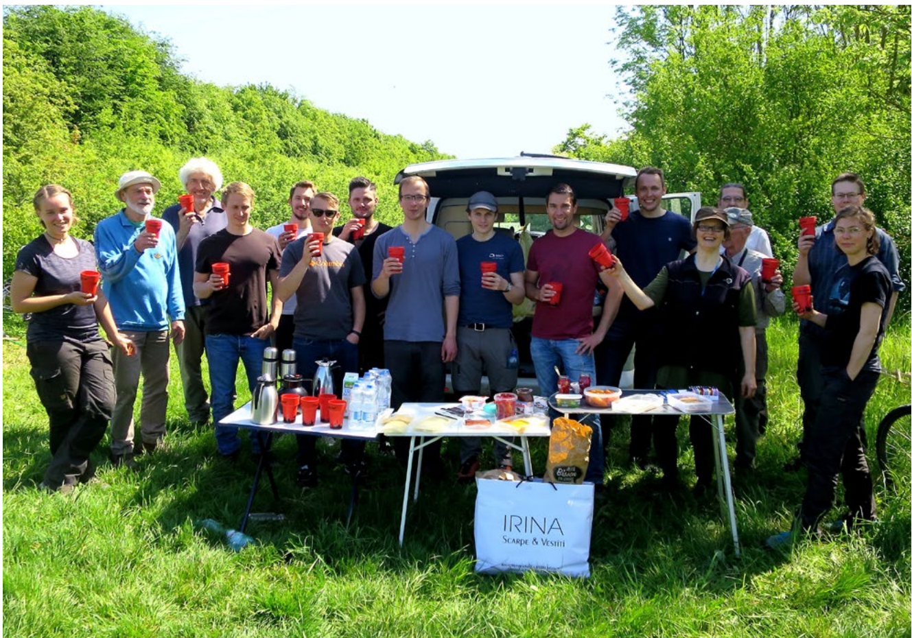
Kronsberg-Frühstück mit Hannocino-Bechern, 23.05.2019.