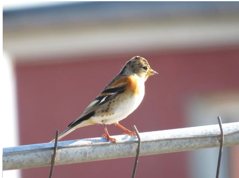
Auf Helgoland lassen sich Bergfinken Fringilla montifringilla im Herbst sehr gut beobachten.

Gimpel Pyrrhula pyrrhula : Ein Trupp aus etwa 15 Ind. flog am 13.11. ins WGG Ricklingen ein (Dierken), was bei dieser Art schon eine bemerkenswerte Ansammlung ist. Unter den im Berichtszeitraum gemeldeten Vögeln waren durch ihre nasalen Rufe gelegentlich wieder sogenannte „Trompetergimpel“ aufgefallen, eine nordosteuropäische Unterart, die hier inzwischen regelmäßig im Herbst/Winter festgestellt wird (Gruber, Lieber u. a.)