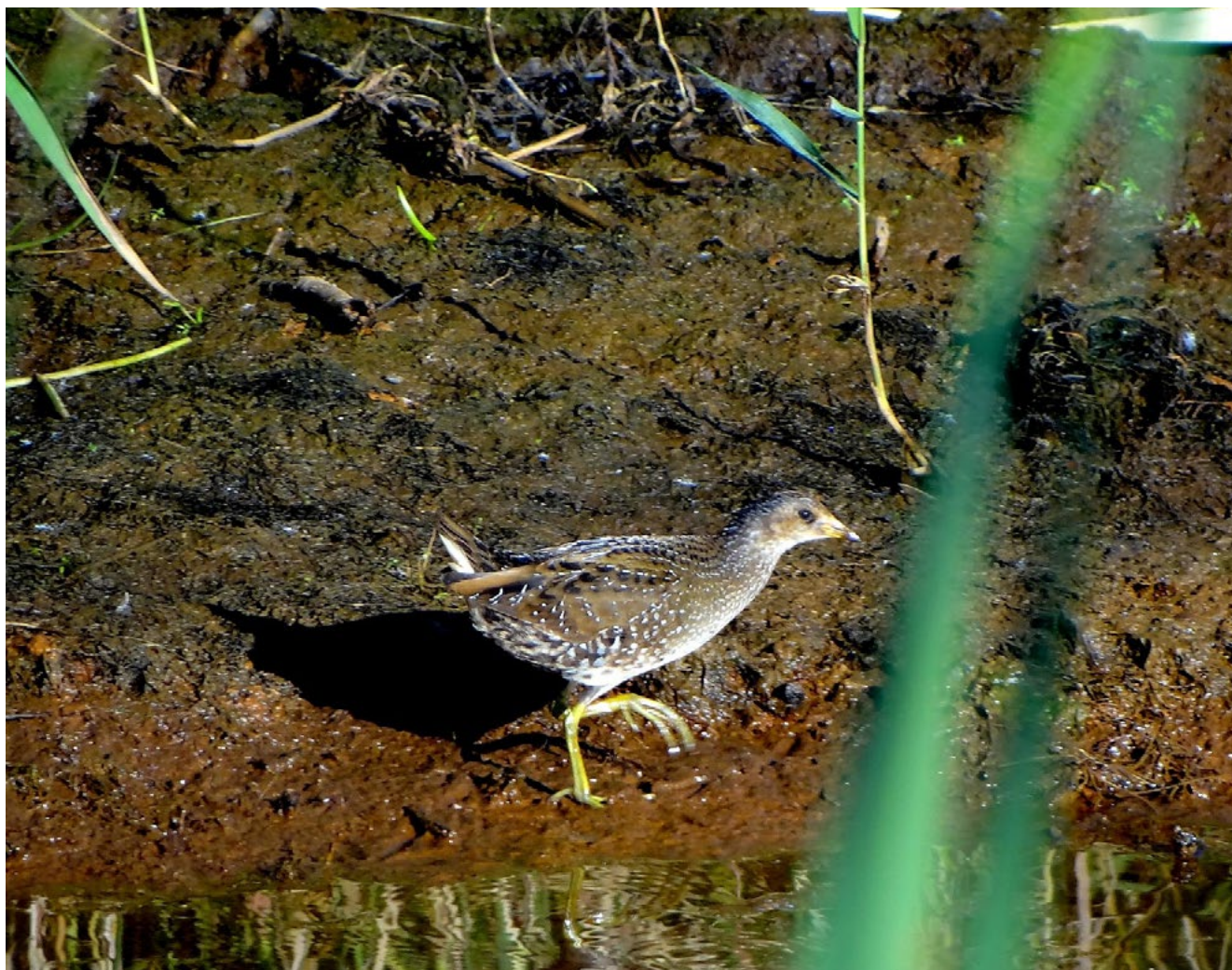
Tüpfelsumpfhuhn Porzana porzana in der Morgensonne, Langenhagen 20.09.2012.