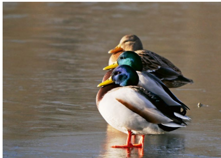
Stockenten Anas platyrhynchos, Hannover 21.01.2017.