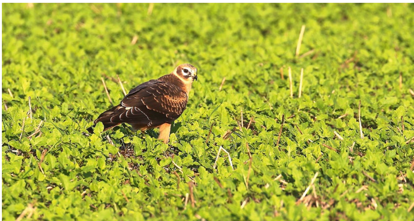
Steppenweihe Circus macrourus (K1), Kemmer Feldmark 30.10.2015.