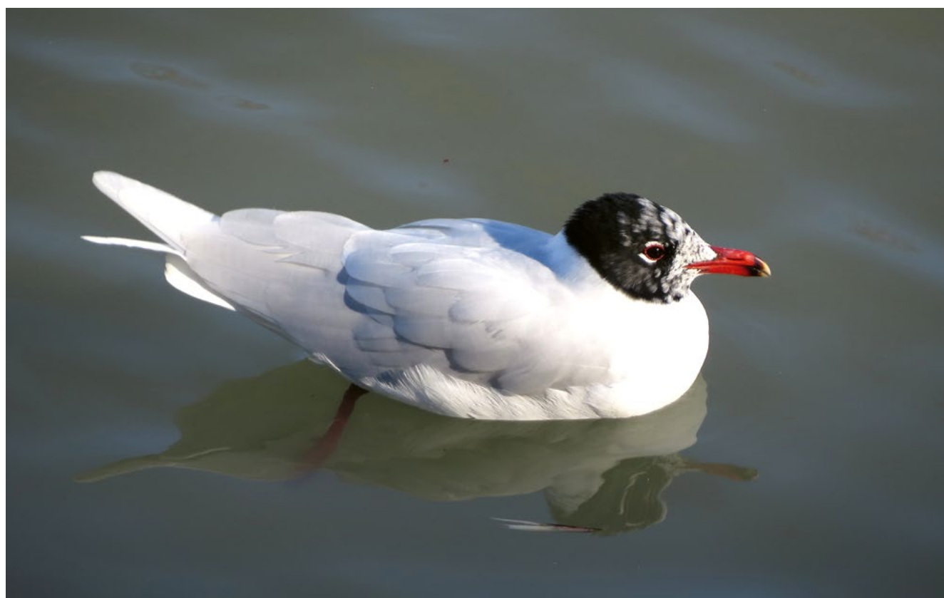
Die Schwarzkopfmöwe Larus melanocephalus am letzten Tag ihres Winteraufenthalts in Hannover am 15.02.2019.