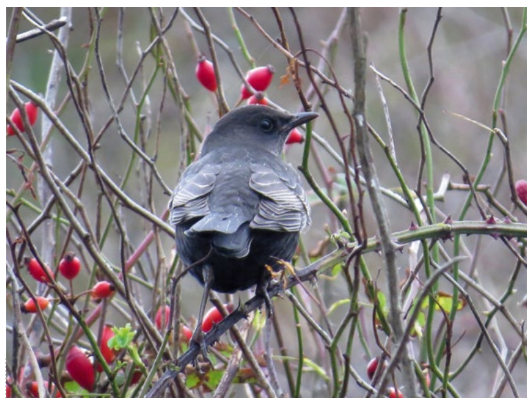
Aus diesem Blickwinkel nur an den hell gesäumten Schirmdrosseln als Ringdrossel Turdus torquatus zu erkennen, Isernhagen 05.10.2018.