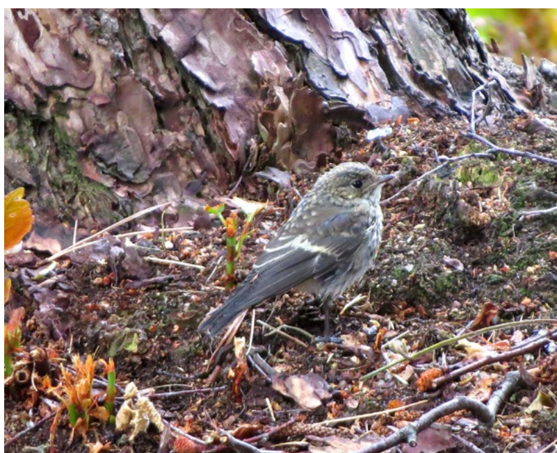
Trauerschnäpper Ficedula hypoleuca im Jugendkleid, Burgwedel 09.07.2019.