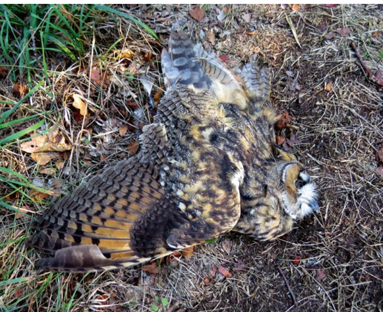
Die verunglückte Waldohreule Asio otus , Isernhagen 19.09.2018.