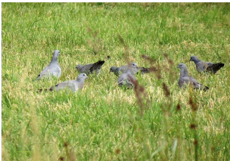
Hohltaubentrupp Columba oenas bei der Nahrungssuche, Burgwedel 09.07.2018.