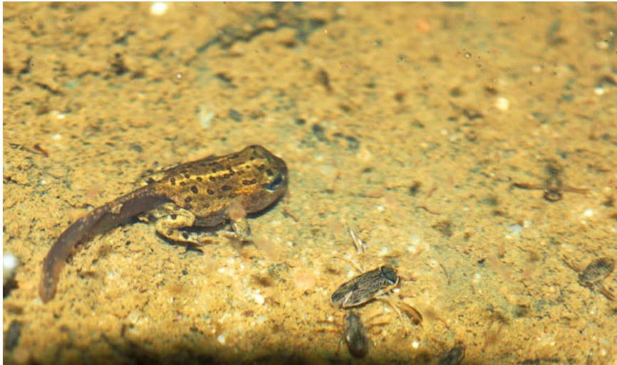
Kreuzkrötenlarve kurz vor der Umwandlung.

Hintergrundinformation: Das Integrierte LIFE-Projekt „Atlantische Sandlandschaften“. Die Maßnahme im Gebiet „Kugelfangtrift und Segelfluggelände“ ist Teil des von der Europäischen Union geförderten Projekts „Atlantische Sandlandschaften“ zum Erhalt der biologischen Vielfalt, das gemeinsam von den Ländern Nordrhein-Westfalen und Niedersachsen umgesetzt wird. Charakteristische Biotope der atlantischen biogeographischen Region, wie zum Beispiel Heide- und Dünenlandschaften, artenreiche Borstgrasrasen und nährstoffarme Stillgewässer, sollen dabei nachhaltig aufgewertet werden. Auch die Bestände der für diese Lebensräume typischen Arten, wie Knoblauchkröte, Kreuzkröte, Schlingnatter und Zauneidechse, sollen gestärkt werden.