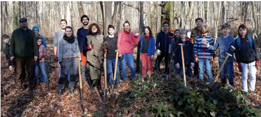
Februar-Arbeitseinsatz in der Eilenriede – eine starke Mannschaft!

Der nächste Termin war dann Anfang Mai, weil im April Osterferien waren und dabei ging es um essbare Wildpflanzen und Kräuter, die gleich in den Quark eingegrührt werden konnten, der zu den Würstchen mit Stockbrot passte.