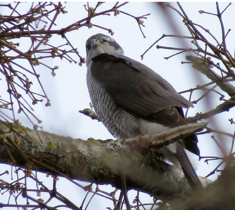
Auf diesem Bild ist die eingeschränkte Sehfähigkeit des Habichts Accipiter gentilis zu erkennen, Ricklingen 12.02.2019.