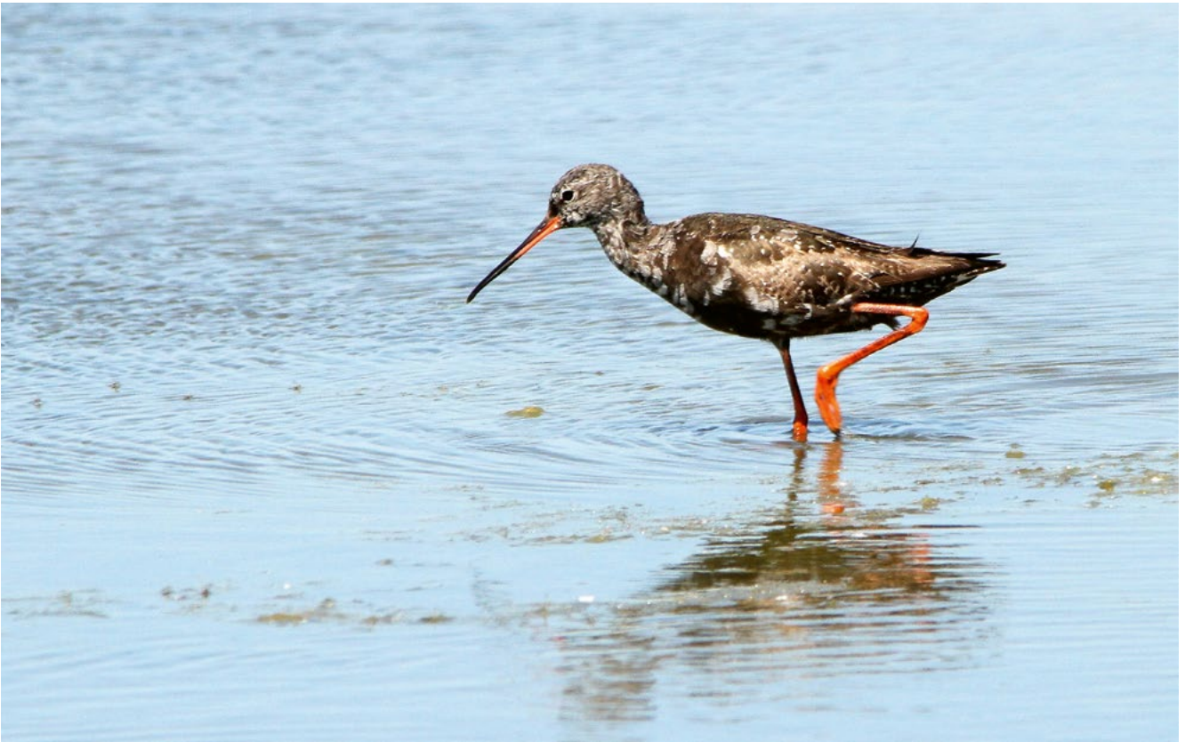
Dieser Dunkle Wasserläufer Tringa erythropus mausert vom Pracht- ins Schlichtkleid, Beltringharder Koog 27.07.2018.