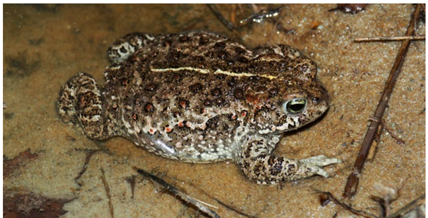
Weibliche Kreuzkröte auf der Kugelfangtrift am 30.03.2019.

Weitere Informationen sind im Internet unter www.sandlandschaften.de verfügbar.