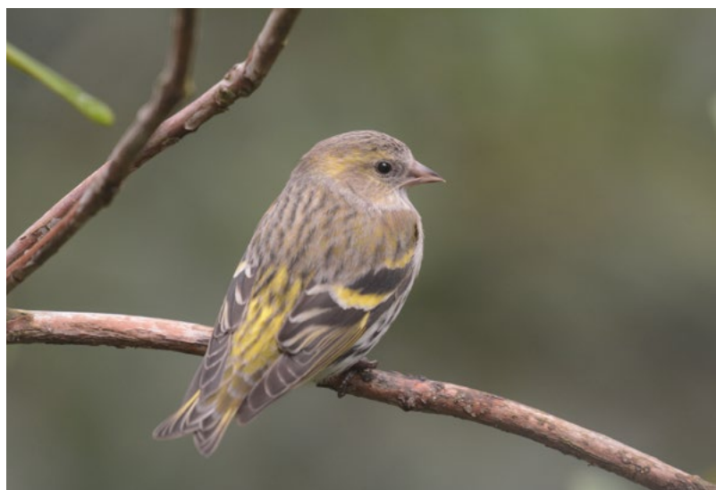
Grünfink Carduelis chloris , Kirchrode 28.03.2019.

Grünfink Carduelis chloris : Aus gerade einmal 40 Ind. bestand der größte Trupp, der während des Berichtszeit-