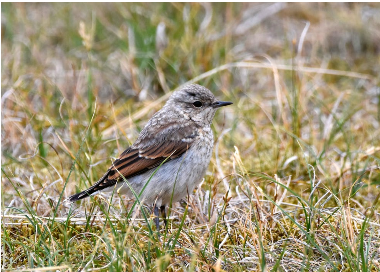
Im Jugendkleid sind Steinschmätzer Oenanthe oenanthe bei uns leider nur sehr selten zu sehen, Norwegen 04.07.2018.