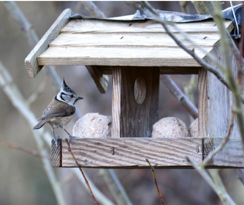
Seltener Gast an einer Futterstelle in Hannover-Kleefeld: Eine Haubenmeise Parus cristatus , 24.02.2018.