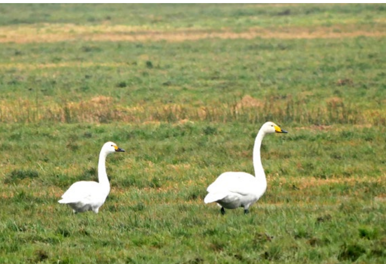
Zwergschwan Cygnus bewickii und Singschwan Cygnus cygnus im Größenvergleich, Meggerdorf SH 25.02.2017.