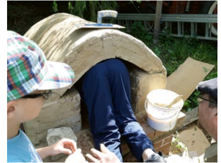
Das Verputzen des neuen Lehmbackofens von innen – ein lustiges Versteckspiel.

Beim ersten Treffen nach den Sommerferien im AbenteuerNaturgarten wurde dann unser „Dutch Oven“ mit einem Schokokuchen eingeweiht. Dabei handelt es sich um einen gusseisernen Topf,