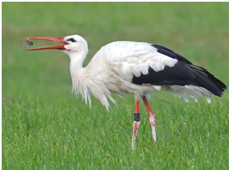
Weißstorch Ciconia ciconia mit Beute und mit einem Ring der Vogelwarte Wilhelmshaven, NSG „Alte Leine“ 18.07.2018.

Fischadler Pandion haliaetus (3/2) : Letzte Wegzügler flogen am 29.09. und 03.10. über den Maschsee, den Hemminger