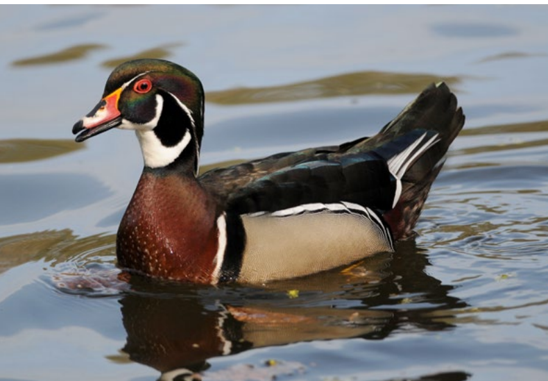
Brauterpel Aix sponsa, Eichenpark Langenhagen 09.04.2011.