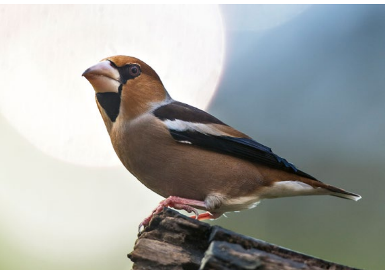
Kernbeißer Coccothraustes coccothraustes , Laatzen

Erlenzeisig Carduelis spinus : Einen Schwarm aus etwa 200 Ind. konnte Steinmetz am 02.02. aus dem NSG „Alte Leine“ melden. Ab dem 14.09. war die Art wieder im HVV-Gebiet aufgefallen und wurde von da an regelmäßig vor allem in der Stadt gesehen. Dreistellige Schwarmgrößen blieben dabei die Ausnahme.