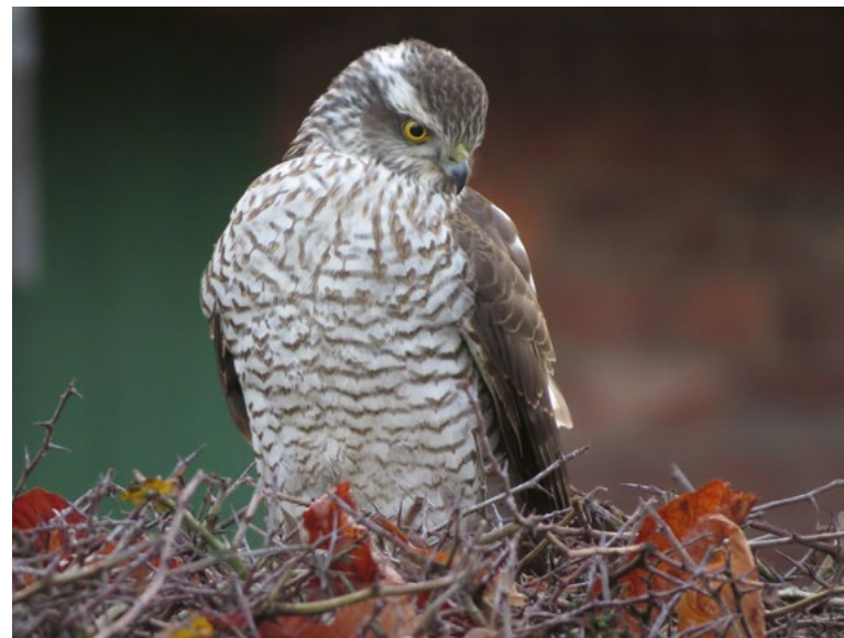
Gebannt startete der Sperber Accipiter nisus (♀) in die Hecke, in der sich die Sperlinge verstecken, Isernhagen 05.12.2018.

Sperber Accipiter nisus : Ein Sperberweibchen war am 05.12.2018 in Isernhagen so sehr auf die Jagd konzentriert, dass es seinen Beobachter völlig ignorierte und sich nicht im geringsten daran störte, aus kürzester Distanz von nur etwa 4 Metern (!) fotografiert zu werden: Der Vogel stand auf einer alten und sehr dicht gewachsenen Grundstückshecke und startete immer wieder gebannt nach unten auf eine kleine Schar Haussperlinge, die darin Schutz vor ihm gesucht hatte. Die Sperlinge schienen eigentlich zum Greifen nah, waren aber im dichten Gewirr der gestutzten Hecke unerreichbar für den Sperber.