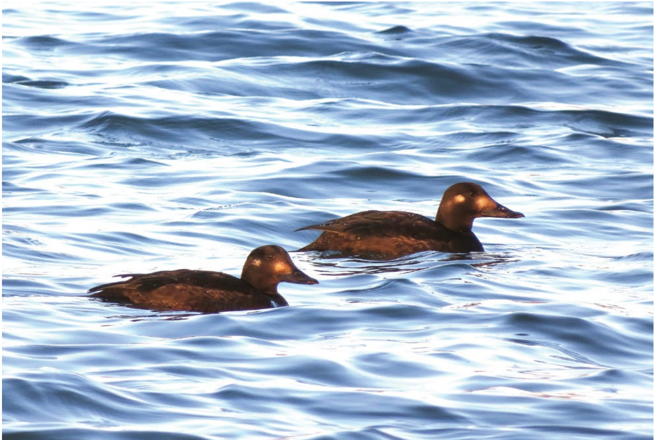
Zwei der Samtenten Melanitta fusca auf dem Maschsee am 04.12.2018.