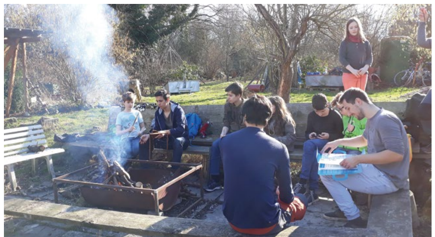
Lagerfeuerromantik im AbenteuerNaturgarten.